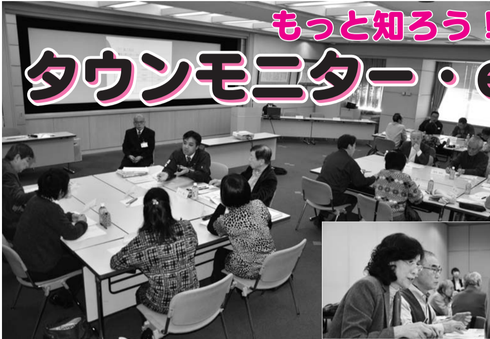
タウンモニター懇談会での意見交換の様子。活気ある話し合いが行われました。