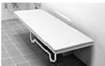
大人用ベッド付トイレ

【区長】①現時点では具体的な施策には至っていない。②UR都市再生機構と情報交換を図り、区の要望を伝える。③以上のほか、日本語が理解できない外国人児童のための日本語学習支援、外国籍の不就学児童、高島第七小学校跡地活用について質問があった。