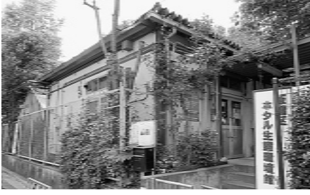
ホテル生態環境館

【区長】①1万人を超える来館者の見学に感謝しており、アンケートは特別公開の率直な感想と認識している。②他自治体の住民にも評価を受け、様々な人の環境意識向上につながることを期待している。③未来創造プランにより、廃止を含めた施設のあり方の検討を進めている。