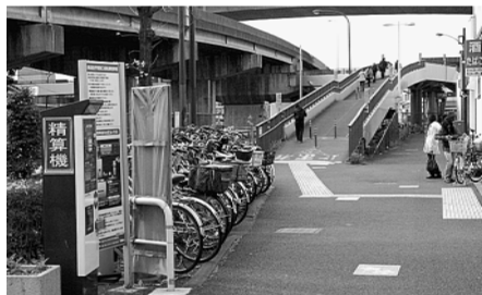
西高島平駅の駐輪場

①需要の低減が見込まれる際は施設の統廃合などで縮減し、増大が見込まれる際は施設の複合化などで拡充していく。②教育環境の維持向上と生徒数の推移や経費などを勘案し対応していく。※以上のほか、命を守る施策としての防災まちづくり、板橋から全国に発信できる産業政策へ、政策経営とは区民の命と暮らしに責任をもつこと、憲法を守る政治について質問があった