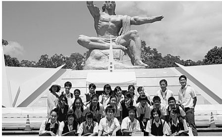
中学生・長崎平和の旅

【質問】①広島・長崎平和の旅事業に派遣する中学生の決定方法は、平和の尊さや戦争の悲惨さの次世代への継承が広がるよう、中学2年生全員対象の作文募集とする検討を。②区ホームページに「区の平和事業」というタブを貼り付け、そこから区の平和事業のすべてが分かるよう、情報の見える化を。