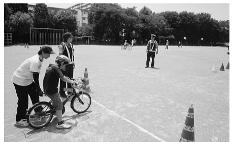
小学生自転車教室の様子

20・30歳代が多い。区内事業者と連携し、社会人へのマナー向上に向けた取り組みを。