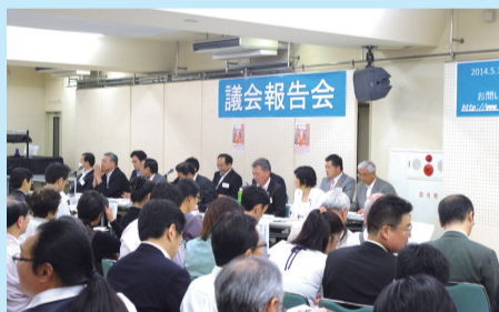
議会報告会の様子