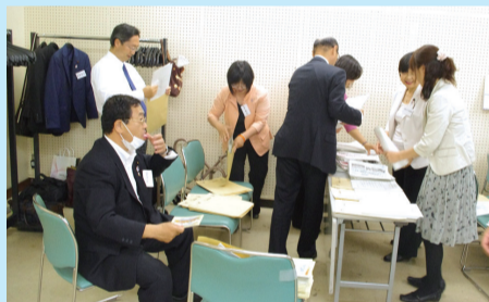
議会報告会の準備の様子

質疑応答では、「公共施設使用料の値上げ」や「コミュニティバスの運行」といった区政に関する質問や要望のほか、「委員長の選任方法」や「議会会派の編成」などの区議会の仕組みに関する質問など、13名の区民から質問や要望がありました。